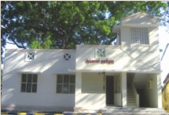
Inspector's quarters at Marakkanam Villupuram Dist.