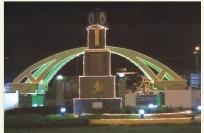
Puzhal Entrance Arch - Illuminated