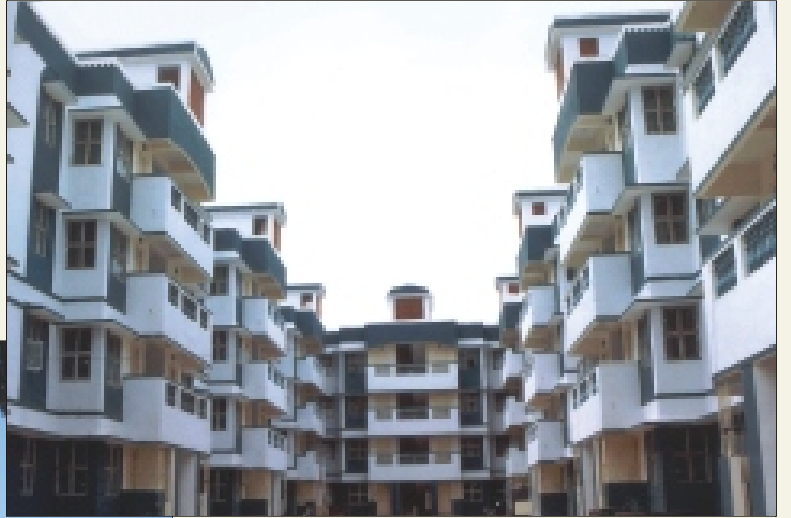
PC's / HC's quarters at Kutchery Road, Chennai

"தரமான நிர்வகித்தல்" மூலம் குடியிருப்போரின் திருப்தியினை மேம்படுத்தலை மைய நோக்கமாக கொண்ட தமிழ்நாடு காவலர் வீட்டு வசதிக் கழகம் 12.12.2003 அன்று தனது "நிர்வகித்தல் ஒழுங்குமுறை" க்காக I.S.O. 9001:2000 தரச்சான்று அங்கீகாரம் பெற்றது. பின்னர் மூன்று ஆண்டில் காலாவதியான தருணத்தில் இத்தரச்சான்று " M/s. Bureau Veritas Certification India Ltd.," வாயிலாக 12.12.2006 இல் இருந்து மேலும் மூன்றாண்டுகளுக்குப் புதுப்பிக்கப்பட்டது.