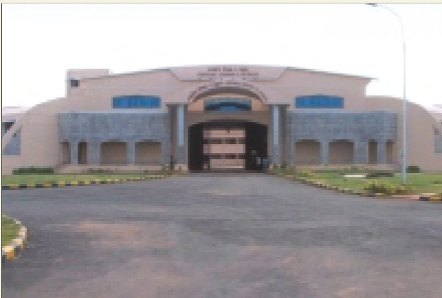
Puzhal Prison Adminstrative Block