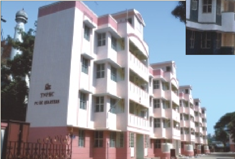
PC's / HC's quarters at Thousand Lights, Chennai.