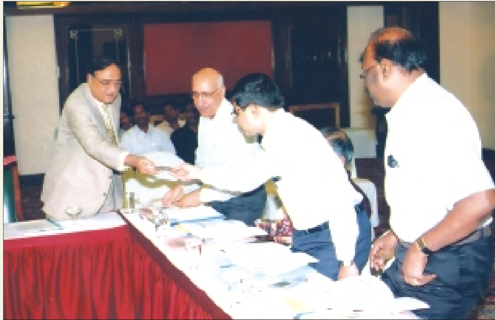
CMD, Board of Directors and Senior Officials of TNPHC