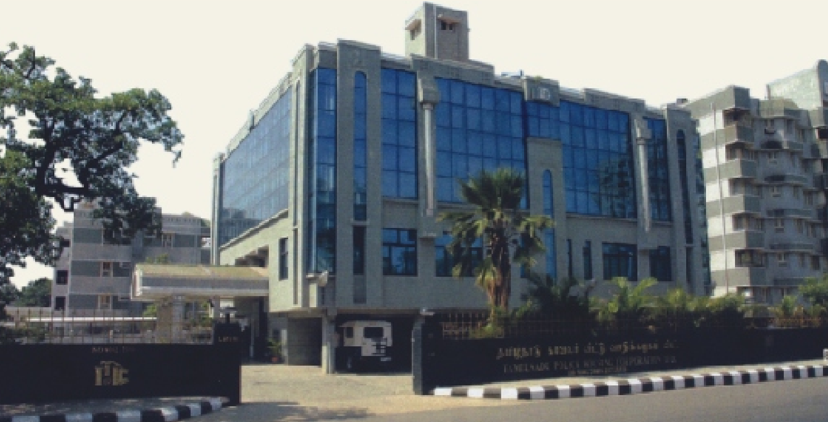
TNPHC Headquarters - Chennai

தமிழ்நாடு காவலர் வீட்டு வசதிக் கழகம் 1981ம் ஆண்டு ஏப்ரல் மாதம், காவல்துறையில் பணியாற்றி ஓய்வு பெற்ற அலுவலர்களுக்காகவும் மற்றும் பணியிலிருக்கும் அலுவலர்களுக்கும் "உங்கள் சொந்த இல்லம் திட்டம்" கீழ் வீடுகள் கட்டிக் கொடுக்கும் நோக்கத்துடன் நிறுவப்பட்டது. பின்னர், பணியில் உள்ள காவல்துறையினரது வீட்டு வசதியின் திருப்திகர அளவினை மேம்படுத்த தமிழ்நாடு அரசு காவல்துறை அலுவலர்களுக்கும் மற்றும் அதிகாரிகளுக்கும் குடியிருப்புகளைக் கட்டுவதென முடிவெடுத்து இக்கட்டுமான பணியினைத் தமிழ்நாடு காவலர் வீட்டு வசதிக் கழகத்திடம் ஒப்புவித்தது. இக்கழகம் தொடங்கிய நாள் முதல் இதுநாள்வரை "உங்கள் சொந்த இல்லம் திட்டம்" கீழ் 1955 வீடுகள் மற்றும் 20627 குடியிருப்புகளையும் கட்டி முடிந்துள்ளது.