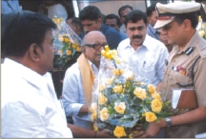
DGP / CMD TNPHC Thiru K.P. Jain welcoming Hon. CM of Tamil Nadu Thiru Kalaignar M. Karunanidhi

Successful completion of the Modern Prison Complex at Puzhal is the latest endorsement of the engineering capabilities of TNPHC. The ongoing projects include the construction of Police Academy at Vandalur at a cost of Rs. 48.23 crores on over 136 acres of land. Another evidence of trust in the TNPHC is the entrusting of the construction of an additional block for the DGP's office at Marina and the new office complex for the Commissioner of Police, Chennai at Vepery by the Government.