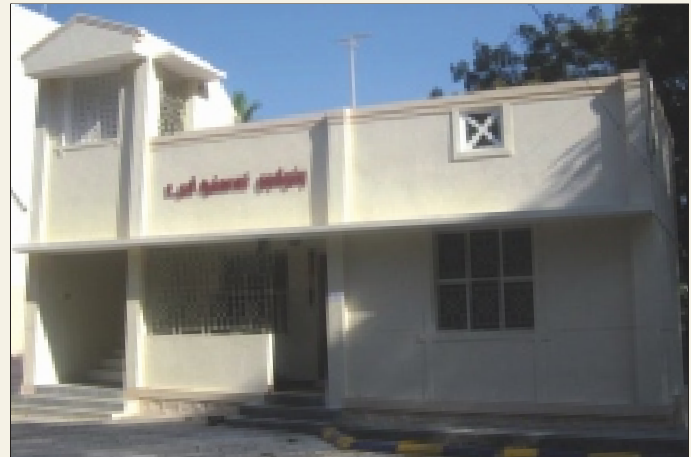
Sub-Inspector's quarters at Marakkanam Villupuram Dist.