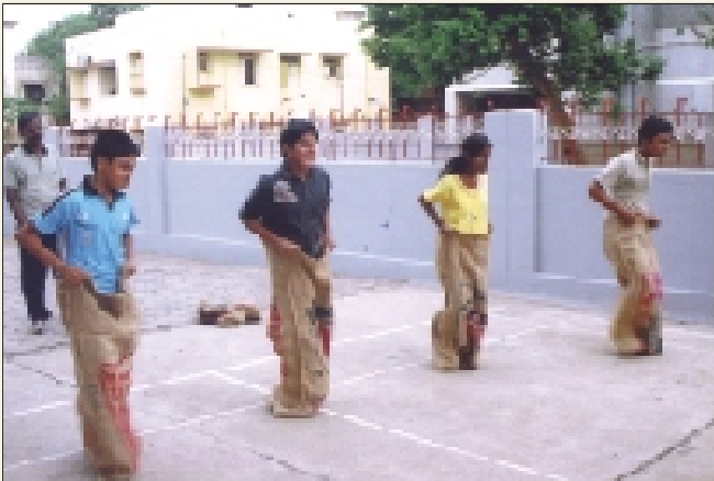
Sack race competition during Independence day celebration

Independence day is celebrated every year in TNPHC by organising competitions in various disciplines for the employees and their Children.