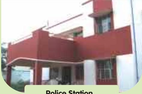
Police Station at Pothanur, Coimbatore District