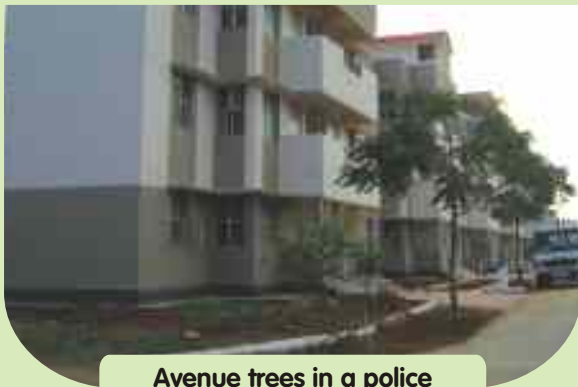
Avenue trees in a police quarters campus