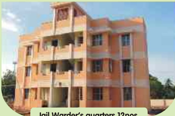
Jail Warder's quarters 12nos, at Palayamkottai