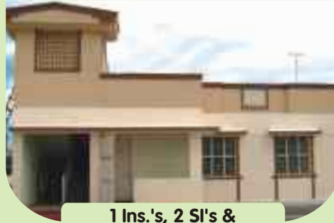
1 Ins.'s, 2 SI's & 74 PC's / HC's quarters at Tirupathur, Vellore District