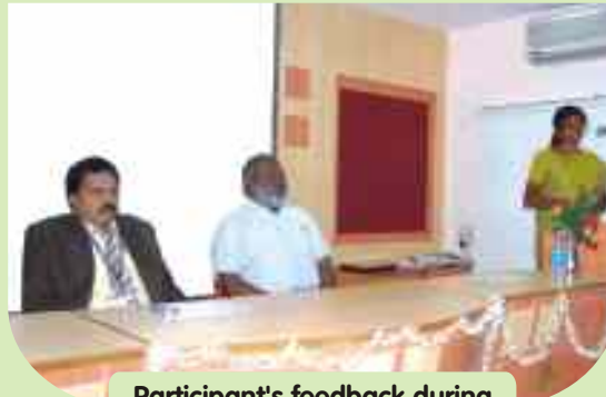
Participant's feedback during valedictory function

TNPHC conducted a 2 day Orientation Programme for new recruits and deputationists on December 7 - 8, 2007 at Alumni Centre, Anna University, Chennai. Lectures were given on materials, engineering detailing, behaviour of structures, construction practices and distress in buildings by eminent engineers and academicians. The top officials of the TNPHC explained the company profile, activities, management and various processes. Sixty seven participants benefited from these lectures and interaction with the speakers. This is the second such training programme conducted during this year.