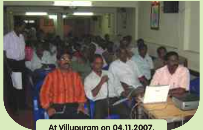
At Villupuram on 04.11.2007.