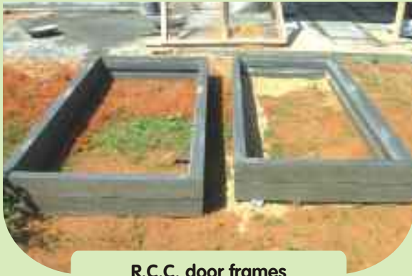
R.C.C. door frames

The TNPHC has also been using Steel / Aluminium windows in coastal areas, PVC doors in toilets, R.C.C. door frames, MDF door shutters and Aluminium partitions with a view to preserving environment.