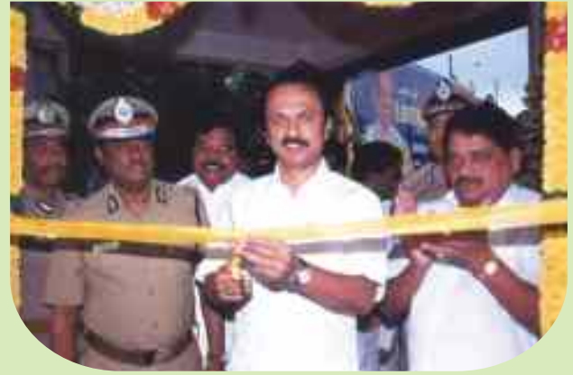
POLICE STATION AT MADHAVARAM

மாண்புமிகு ஊரக வளர்ச்சி மற்றும் உள்ளாட்சித்துறை அமைச்சர் திரு. மு. க. ஸ்டாலின் அவர்கள் சென்னை மாதவரத்தில் ரூ. 21.87 இலட்சத்தில் கட்டப்பட்ட காவல் நிலையத்தை 24.10.2007 அன்று திறந்து வைத்தார்கள். மேலும் ரூ. 3 கோடி மதிப்பில் கட்டப்பட்ட நாமக்கல் மாவட்ட காவல் அலுவலகத்தினை 26.10.2007 அன்று திறந்து வைத்தார்கள்.