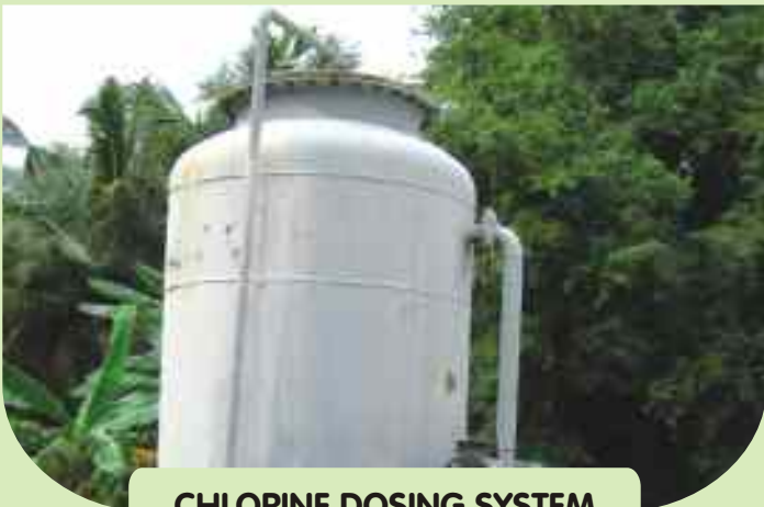
CHLORINE DOSING SYSTEM