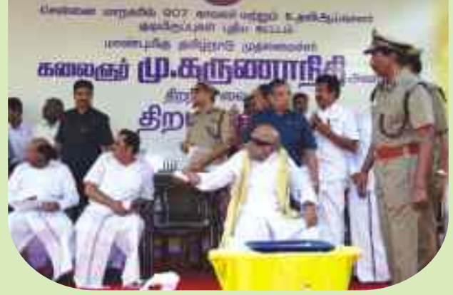
INAUGURAL FUNCTIONS PRESIDED OVER BY THE HON'BLE MINISTER FOR RURAL DEVELOPMENT & LOCAL ADMINISTRATION