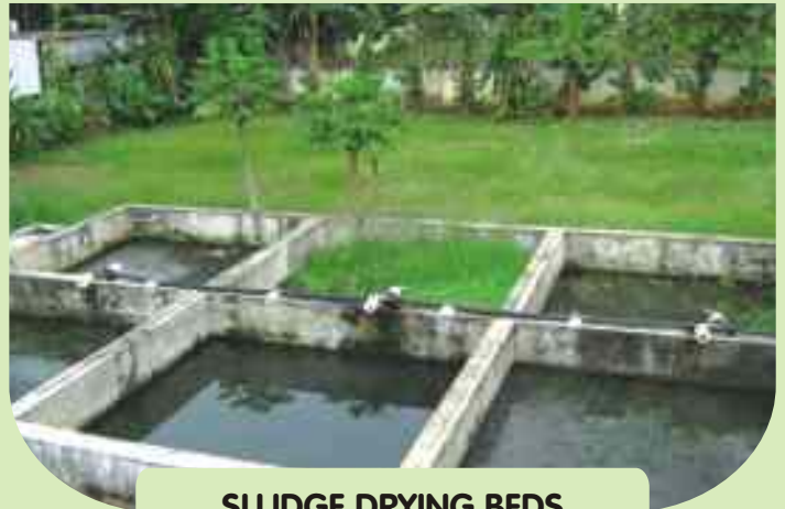
SLUDGE DRYING BEDS