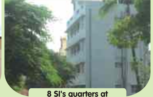
8 SI's quarters at Coimbatore, PRS