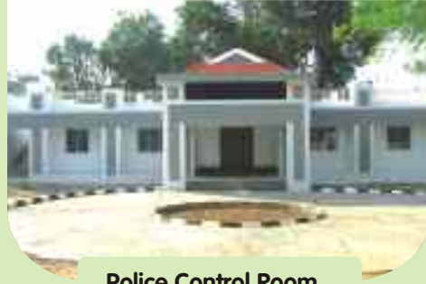
Police Control Room at Salem