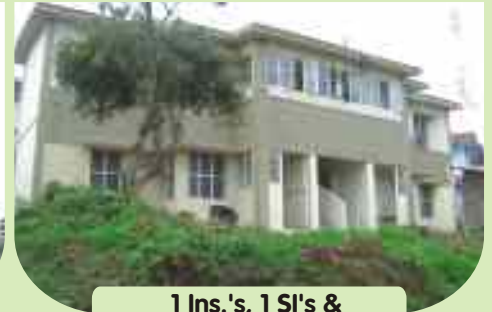
1 Ins.'s, 1 SI's & 14 PC's / HC's quarters at Kothagiri, Nilgiris District