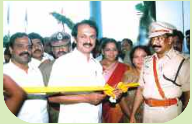
DISTRICT POLICE OFFICE AT NAMAKKAL