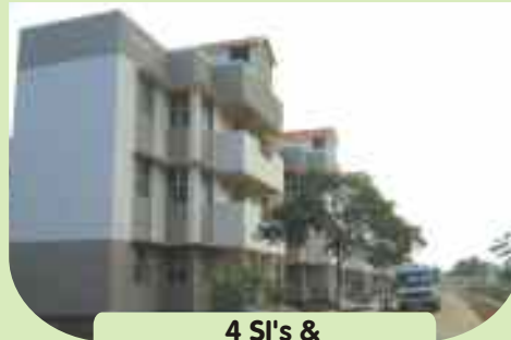
4 SI's & 76 PC's / HC's quarters at Kovaipudur, Coimbatore District