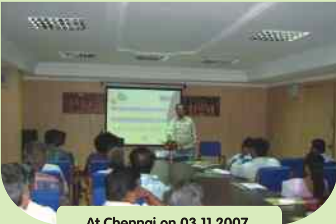
At Chennai on 03.11.2007.