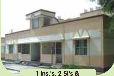
1 Ins.'s, 2 SI's & 21 PC's / HC's quarters at Gudiyatham, Vellore District