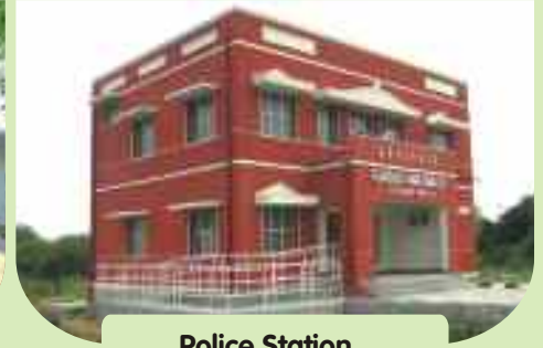
Police Station at Maruvathur, Perambalur District