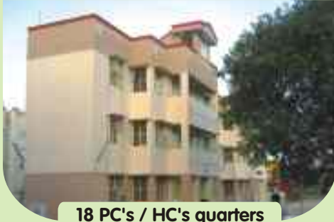
18 PC's / HC's quarters at Ulundurpet, Villupuram District