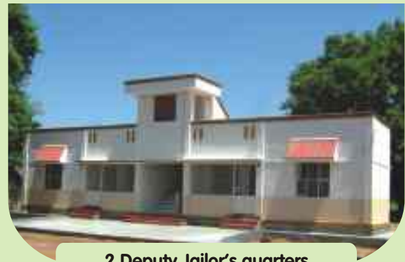
2 Deputy Jailor's quarters special prison for women at Vellore