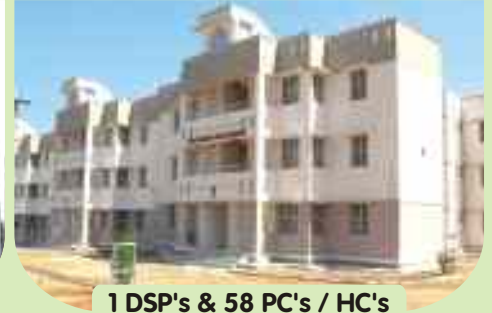
1 DSP's & 58 PC's / HC's quarters at Thiruvannamalai