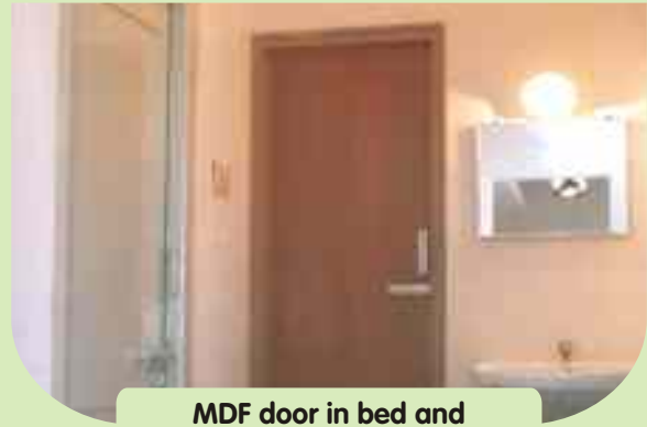
MDF door in bed and PVC door in toilet