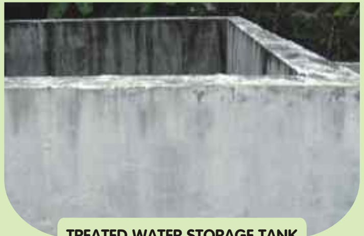
TREATED WATER STORAGE TANK