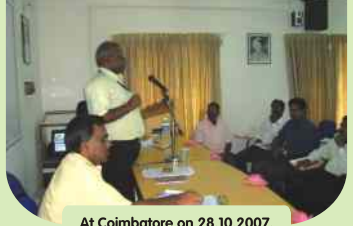
At Coimbatore on 28.10.2007.