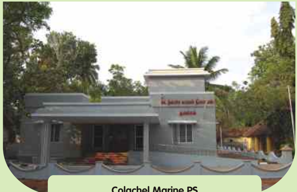
Colachel Marine PS