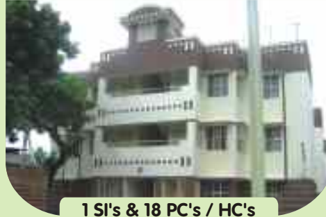
1 SI's & 18 PC's / HC's quarters at Villupuram West