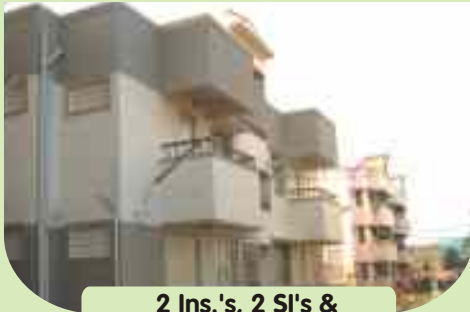
2 Ins.'s, 2 SI's & 38 PC's / HC's quarters at Rasipuram, Namakkal District