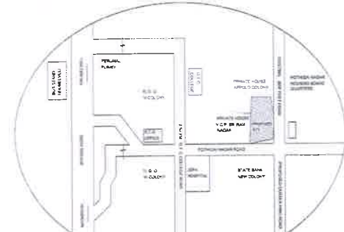
KEY PLAN NOT TO SCALE