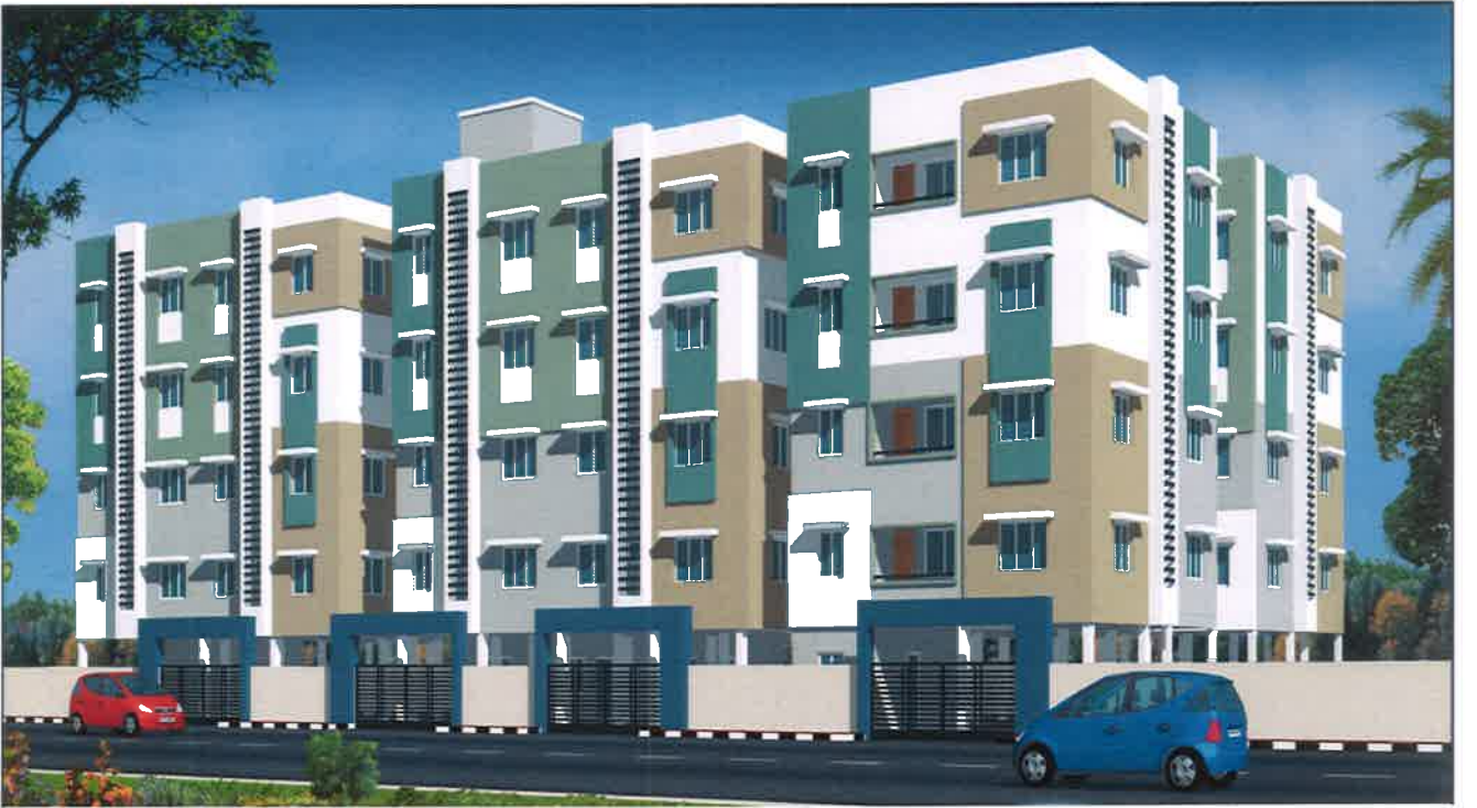
'A' மற்றும் 'B' Block ( Stilt + 4 floors)

மாடிக்குடியிருப்பு படம் மற்றும் கட்டப் பரப்பளவு வரைபடம்